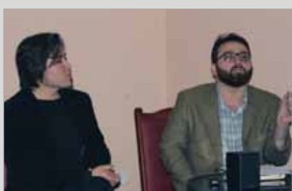
سفارت سوئیس در کابل: شانس‌های افغانستان در «جشنواره لوکارنو» دارند هیچ کشوری ندارد