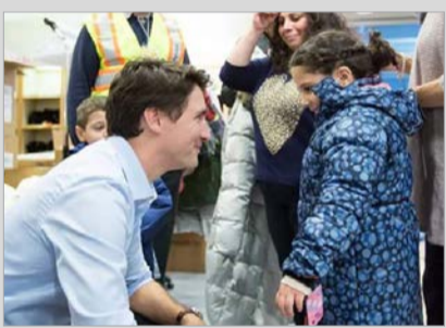
کانادا از ورود مهاجرین مسلمان استقبال می کند