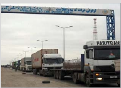
بازداشت شماری از کارمندان گمرک هرات به اتهام فساد