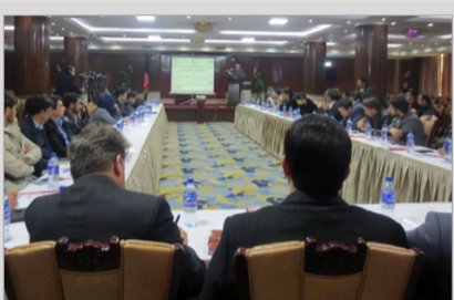
وزارت مخابرات: سیستم واحد اطلاعات جغرافیایی تا سه سال آینده ایجاد خواهد شد