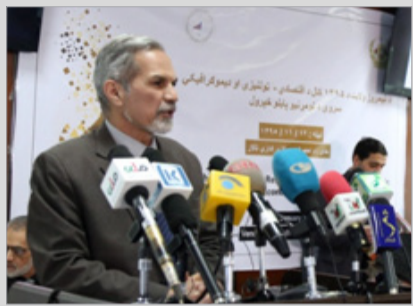
احصایه مرکزی: بیشتر از پنجاه و هفت درصد مردم نیمروز مکتب نرفته‌اند

سال دهم ◊ شماره مسلسل ۲۵۵۷ ◊ چهارشنبه ۱۳ دلو ۱۳۹۵ ◊ قیمت ۲۰ افغانی