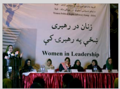
فهرست‌سازی از زنان نخبه برای رفع بهانه‌ها