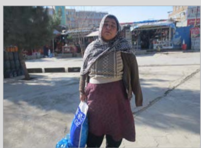
زنی که دستش را از دست داد، «تندی» می‌فروشد تا نان بخرد