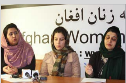
انتقاد شدید شبکه زنان از بی تفاوتی مسوولان در برابر خشونت های اخیر