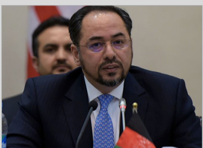
وزیر خارجه فردا برای گسترش همکاری ها به مسکو می رود