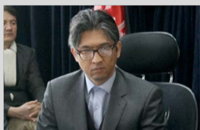
سردار رحیمی: با تغییر نصاب توان مندی سوادآموزان را بالا می بریم