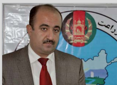
پیشکش های جدید وزارت زراعت برای مبارزه با کشت کوکنار