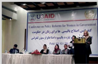
ضرورت اصلاح پالیسی های اداری جهت مصون سازی فضای کاری برای زنان