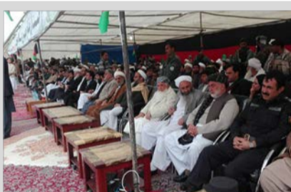
اسماعیل خان: شماری جنایت کار برای مردم افغانستان دردسر ساز شده اند