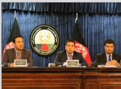
افزایش ۳۷۰ میلیونی درآمد تصدی مواد نفتی