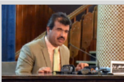
لیوال: «طرح حل مشکل با پاکستان» را به رهبران حکومت سپرده ایم