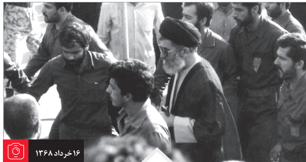
حضور رهبر انقلاب در مصالای تهران، برای تشییع پیکر مطهر حضرت امام (علیه السلام)

اعتقاد این است که مهمترین خصلت امام بزرگوار ما این بود که خویش و بیگانه و دوست و آشنا، برایش فرقی نداشت. حقیقتاً خدا می‌داند که آن بزرگوار در این دنیای تاریک ظلمانی، مثل یک خورشید، چند صباحی آمد درخشید و رفت، تا مردم بدانند که خورشیدی هم هست. دیگر بعد از آنمه و معصومین، ما و دیگران هم مثل آن آدم سراغ نداریم... آن مرد، اگر می‌فهمید که تکلیف است، عمل می‌کرد... آن روزی که او به مردم خطاب کرد و مبارزه را شروع نمود، در بین علما و بزرگان و شخصیت‌های برجسته و انسانهای لایقی که بودند، انصافاً هیچ کس گمان نمی‌کرد که مردم پشت سر کسی که صاحب این دعوت و فریاد است، راه بیفتند. البته امام به مردم ایمان داشت و معتقد بود که می‌آیند؛ اما در عین حال، آن دریدالی از توکل به خدا و این که من تکلیفم را عمل می‌کنم، می‌خواهند بیایند، می‌خواهند نیابند، مهم بود. خدای متعال هم قاعده‌ی دارد: «من کان لله کان الله له» (۱). «من اصلاح فیما بینة و بین الله اصلاح الله فیما بینة و بین الناس» (۲). هر کس بین خود و خدا در دست و اصلاح کند، خدا بین او و مردم را در دست خواهد کرد. ● ۶۹/۱/۱۰ (۱) بحار الأنوار، ج ۲۹، ص ۱۹۷. (۲) نهج البلاغه: حکمت ۸۹.