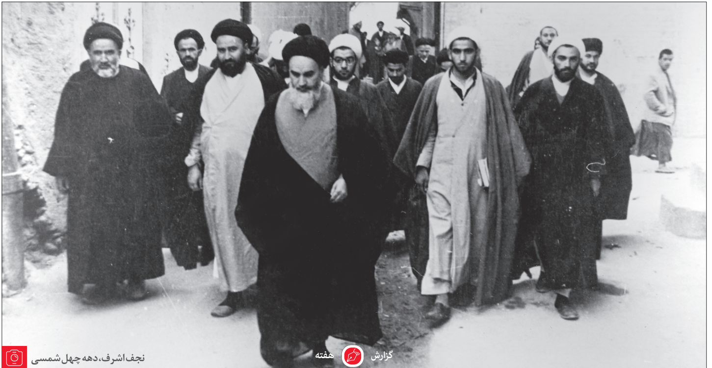
نجف اشرف، دهه چهل شمسی