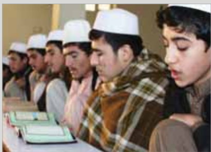
«مدرسه‌های غیررسمی افراطیت مذهبی پخش می‌کنند»