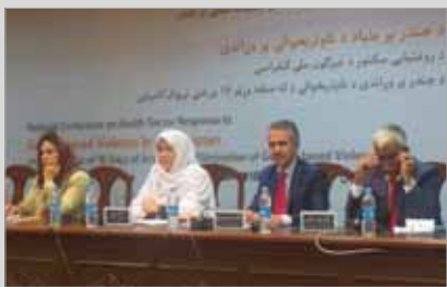
صندوق جمعیت ملل متحد دراغانستان: ۸۰ درصد زنان از یک نوع خشونت رنج می‌برند