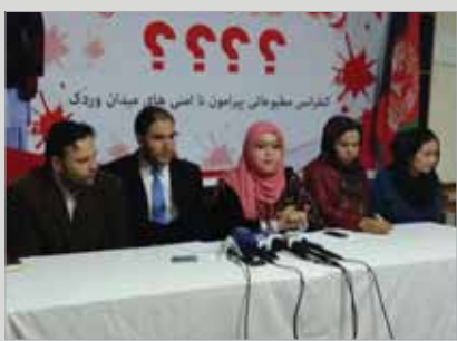
انتقاد فعالان مدنی از بدتر شدن وضعیت امنیتی میدان وردک