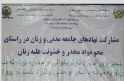
مشارکت نهادهای جامعه مدنی و زنان در راستای محو مواد مخدر و خشونت علیه زنان