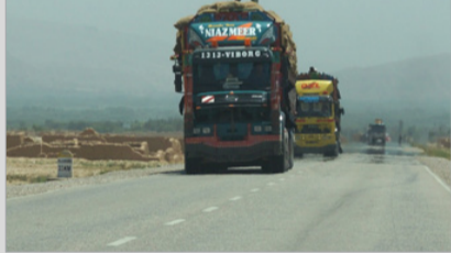
مرگ آفرینی رانندگان در شاهراه های افغانستان