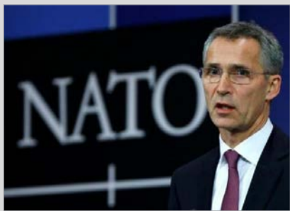
افغانستان و گزارش اصلاحات به ناتو

سال دهم ◊ شماره مسلسل ۲۵۱۸ ◊ چهارشنبه ۱۷ قوس ۱۳۹۵ ◊ قیمت ۲۰ افغانی