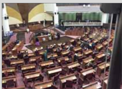
اعضای مجلس: سلب صلاحیت شده‌ها وزیر نیستند