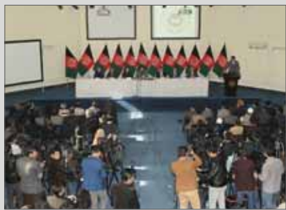
رئیس کمیسیون مستقل انتخابات: اصلاحات قانونی و شفافیت می‌آوریم