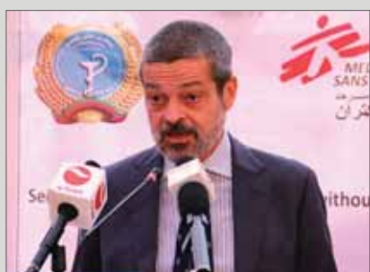
داکتران بدون مرز فعالیت‌های خود را در افغانستان گسترش می‌دهد