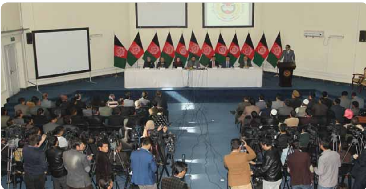
رییس کمیسیون مستقل انتخابات:

پیش از این انتقادهایی در باره‌ی این که اصلاحات انتخاباتی تنها با تغییر چهره‌ها ممکن نیست و باید اصلاحات عملاً پیاده شوند، اینک اما رییس جدید کمیسیون