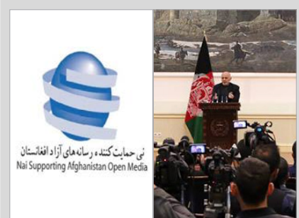
نهاد حمایت از رسانه‌های آزاد «نی»: قانون بالاتر از تفاهم است