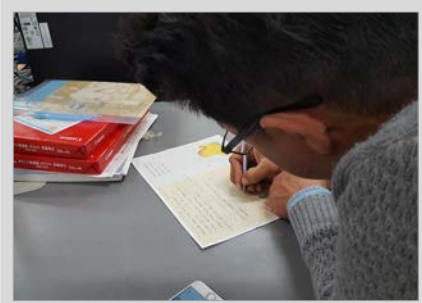
«گهواره» دنیای کودکان افغان را به جهان کودکان گره می‌زند