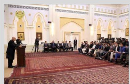
رئیس جمهور: شریان‌های آسیای مرکزی به روی افغانستان باز شده است

سال یازدهم ◊ شماره مسلسل ۲۶۰۲ ◊ دوشنبه ۲۱ حمل ۱۳۹۶ ◊ قیمت ۲۰ افغانی