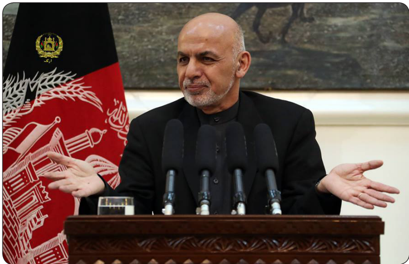
● سلیم سرلند

می‌داند که یک قرارداد نانوشته میان خبرنگاران و افکار عمومی وجود دارد. خبرنگاران سوال‌های افکار عمومی را مطرح می‌کنند. گروه‌های ارتباط عامه و رسانه‌های سازمان‌های مختلف از جمله نهاد ریاست جمهوری هم وظیفه دارند که سوال‌های افکار عمومی را به اطلاع ریاست جمهوری برسانند تا در سیاست‌گذاری‌ها مدنظر قرار گیرد. وظیفه‌ی گروه رسانه‌ای و ارتباط عامه‌ی سازمان‌های دولتی از جمله ریاست جمهوری، صرف توجیه‌گری نیست. این گروه باید در سیاست‌گذاری‌ها سهم داشته باشند، باید طرف مشورت رییس جمهور باشند، باید رییس جمهور از آنان حساب ببرد.