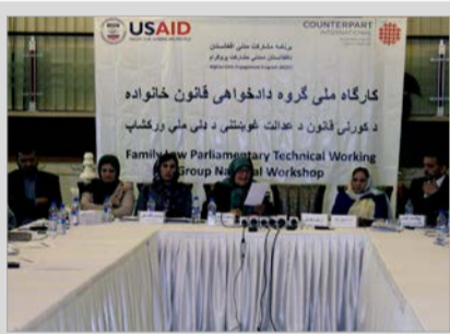
پیش نویس قانون خانواده به مصر می رود