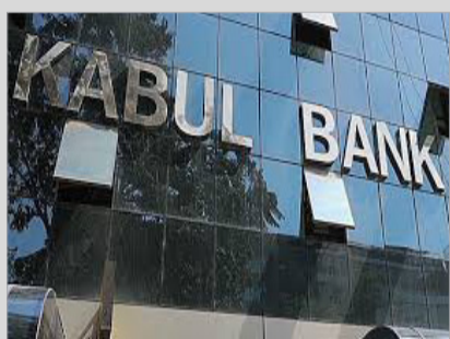
چگونگی فساد و شکست کابل بانک