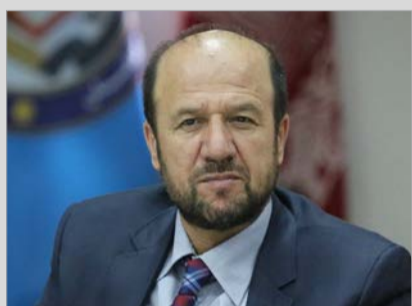
حوزه پنجم کابل، بهشت امن مجرمان