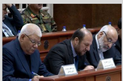
خون قربانیان حادثه چهارصد بستر توسط مجلس نادیده گرفته شد