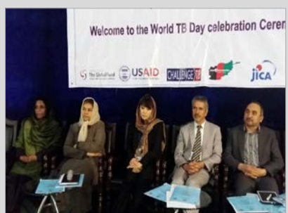
دو سوم مبتلایان به توبرکلوز زنانند