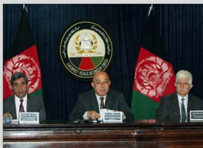
برکناری نزدیک به ۱۴۰۰ تن به اتهام فساد از وزارت دفاع

سال یازدهم ◊ شماره مسلسل ۲۵۹۴ ◊ چهارشنبه ۹ حمل ۱۳۹۶ ◊ قیمت ۲۰ افغانی