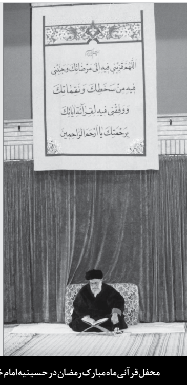
محل قرآنی ماه مبارک رمضان در حسینیه امام خمینی (ره) در دهه هفتاد

قرآن، هم کتاب علم و معرفت است یعنی دل را و اندیشه‌ی انسانی را سیراب می‌کند - قرآن برای آن کسانی که اهل معرفت‌آموزی هستند یک سرچشمه‌ی تمام‌نشدنی است - لکن علاوه‌ی بر اینها قرآن دستور زندگی هم هست؛ قرآن علاوه‌ی بر جنبه‌ی معرفتی و معرفت‌آموزی دستورات کاربردی دارد برای زندگی؛ یعنی محیط زندگی را آباد می‌کند، زندگی را از امنیت و سلامت و آسایش برخوردار می‌کند. ● ۹۹/۲/۶