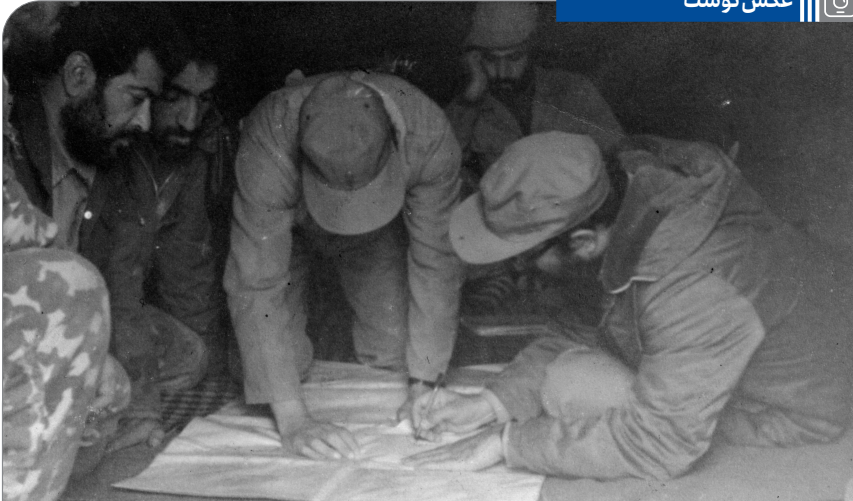
آیت‌الله خامنه‌ای در کنار شهید چمران - مهرماه ۱۳۵۹ | استاد لشگر ۹۲ زرهی نیروی زمینی ارتش اهواز

مرحوم چمران در قضایای قبل از انقلاب، در فلسطین و مصر تمرین دیده بود. به خلاف ما که هیچ سابقه نداشتیم، ایشان سابقه نظامی حسابی داشت و از لحاظ جسمانی هم، از من قوی‌تر و کار کشته‌تر و زنده‌تر بود. لذا، وقتی صحبت شد که (کی فرمانده این عملیات باشد؟) همه نظر دادیم که مرحوم چمران، فرمانده این تشکیلات [ستاد جنگ‌های نامنظم] شود. ● ۷۲/۰۶/۱۱