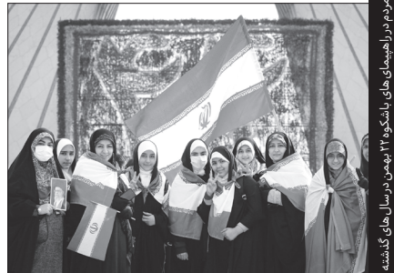
تصاویری از حضور مردم در راهپیمایی‌های باشکوه ۲۲ بهمن در سال‌های گذشته

حضور پرشور و شعور مردم در چهل و پنج جشن ملی برای انقلاب اسلامی ایران نشانه چیست؟