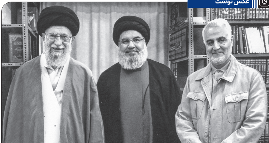
دبیرکل حزب الله لبنان و فرمانده شهید نیروی قدس سپاه در کنار رهبر انقلاب اسلامی