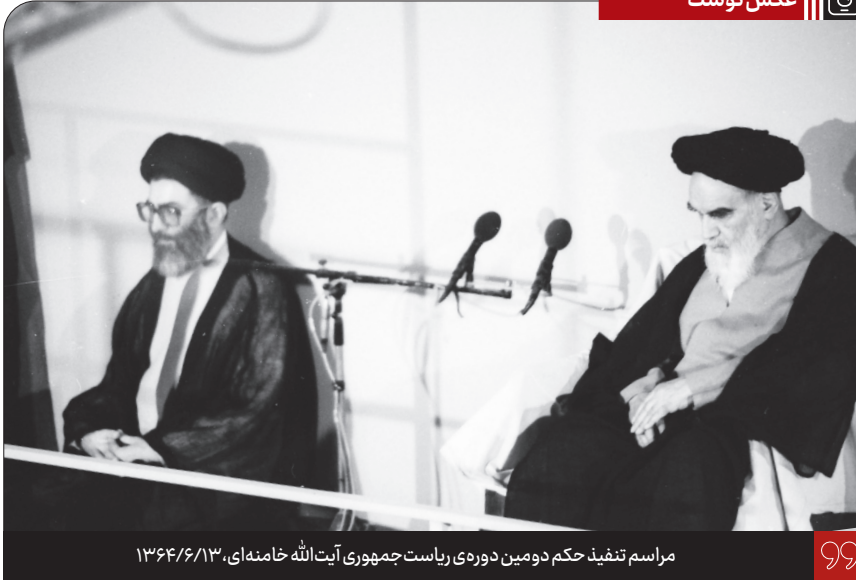
مراسم تنفیذ حکم دومین دوره ریاست جمهوری آیت‌الله خامنه‌ای، ۱۳۶۴/۶/۱۳

در کشور ما کودتای ۲۸ مرداد را امریکایی‌ها به راه انداختند و بیست و پنج سال سخت‌ترین و سیاه‌ترین دیکتاتوری را در این کشور به وجود آوردند و قرص و محکم از آن حمایت کردند. هر فاجعه‌ای که به وسیله آن رژیم در ایران صورت گرفت - مثل قضایای ۱۵ خرداد و ۱۷ شهریور که در هر کدام از این حوادث، تعداد کثیری از مردم غیرنظامی و مردم کوچه و خیابان به دست عوامل مزدور رژیم کشته شدند - امریکایی‌ها جانب رژیم دیکتاتوری را گرفتند و علیه مردم حرف زدند؛ چه در قضیه اول که زمان «کندی» بود، چه در قضیه دوم که زمان «کارتر» بود. از (صدام حسین)... چه حمایتها کردند. امروز وضع آنها بهتر از گذشته نیست؛ همان طور است. ۱۳۸۲/۸/۲۳ انتشار به مناسبت بزرگداشت قیام ۱۷ شهریورماه و گستر جمع‌ی از مردم به دست ماموران ستمشاهی پهلوی (۱۳۵۷ ه. ش)